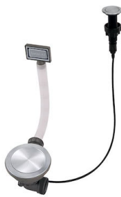
自动下水器 Space 8407 116